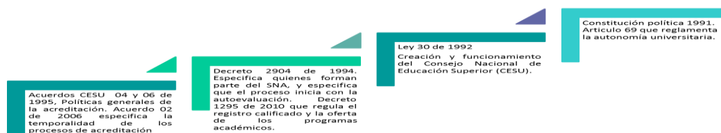
Figura 1. Marco legal del aseguramiento de la calidad en Colombia

Posteriormente, el mismo CESU mediante el Acuerdo 02 de 2005, hace algunas precisiones acerca de la temporalidad de los procesos de acreditación, sobre el procedimiento para la renovación de la acreditación.